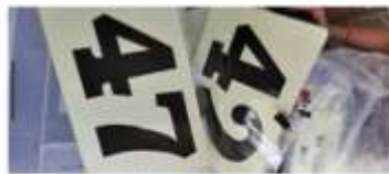
号码牌在禅堂门口领取 出禅堂时请将号码牌放回原位